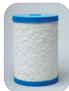
CB6 Filtro de Reemplazo para modelos MP750 Series (9¢/gal) $69.95 más imp. y gastos de envío