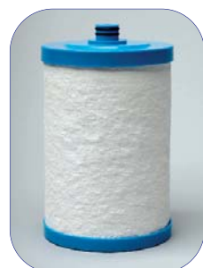
CB6AD Filtro de Reemplazo para modelos MPAD (9¢/gal) $69.95 más imp. y gastos de envío